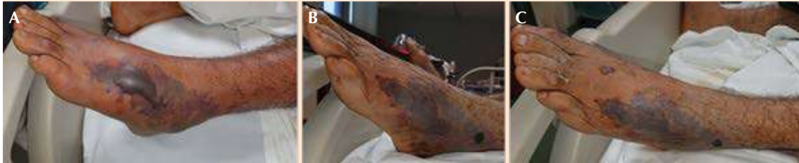
Figura 1. A. Lesión inicial. B y C. Mejoría clínica posterior al periodo de sepsis.

Se trató con líquidos altos, antimicrobiano empírico con carbapenémico y vancomicina. El paciente tuvo evolución tórpida con hipotensión resistente a líquidos, por lo que requirió la administración de vasopresores; se trasladó a la unidad de cuidados intermedios en donde se administró faboterápico tres días después de la mordedura de araña. Al tercer día del ingreso al hospital (5 días posteriores a la mordedura de araña), el paciente tuvo datos de dificultad respiratoria aguda, con datos clínicos y radiográficos de edema agudo pulmonar, así como acidosis respiratoria e hipoxemia, por lo que requirió apoyo con inotrópicos y ventilación mecánica invasiva. Tuvo, además, oliguria y aumento de azoados de manera progresiva requiriendo terapia renal de reemplazo continuo. Se tomaron enzimas cardíacas que reportaron CK 183 UI/L, CKMB 78 UI/L, troponina 15.4 ng/mL, péptido natriurético cerebral (BNP) 1086.6 ng/mL. Electrocardiograma con inversión de la onda T sugerente de isquemia, por lo que se solicitó ecocardiograma transtorácico ( Figura 2 ), mismo que reportó disfunción sistólica severa del ventrículo izquierdo sin alteraciones de la contractilidad de algún sitio con función del ventrículo derecho conservada y sin alteraciones en la morfología o función de válvulas, por lo que se descartaron datos de isquemia miocárdica. En la resonancia magnética cardíaca el realce tardío de gadolinio pudo distinguir del de la miocardiopatía isquémica. Figura 3