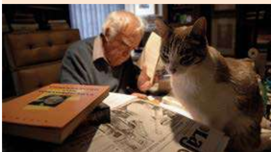
Figura 4. Carlos Monsiváis con uno de sus afamados gatos. (La vida de Carlos Monsiváis a través de... ¿sus gatos?) https://news.culturacolectiva.com/mexico/aniversario-luctuoso-de-carlos-monsivais/

Se comenta que el origen de la permisión a este grupo desde la fundación del Instituto fue el control de plagas, lo cual aparentemente lo hacen muy bien porque en nuestras 8 hectáreas