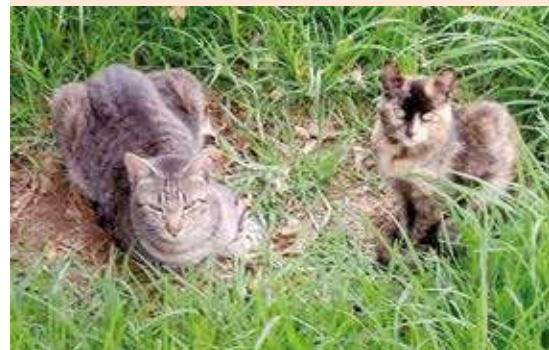
Figura 3. Felinos en receso en el bosque del INER.

Algo que inicialmente sorprende en ese bosque es encontrar a unos seres que lo disfrutaran enormemente, los cuales los vemos en camadas y en un número considerable de decenas, son los denominados gatos del INER . Figura 3