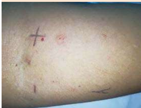
Figura 3. Pruebas cutáneas a Aspergillus fumigatus . Control negativo (Evans): 0 mm eritema ausente. Control positivo (histamina): 5 mm eritema 2 ++. Aspergillus fumigatus : 3 mm eritema +.

broncopulmonar alérgica etapa 1 con sobreinfección con Streptococcus pneumoniae .