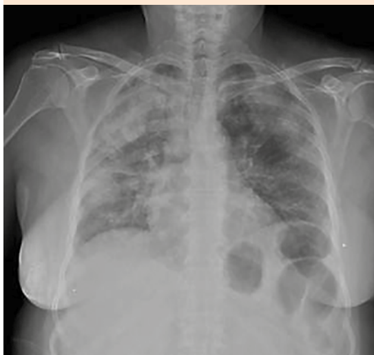
Figura 1. Telerradiografía de tórax. Opacidades subsegmentarias parcheadas bilaterales circulares sugierentes de ocupación alveolar, localizadas en la región interescápulo-vertebral externa y parahiliar del hemitórax derecho debajo de la cisura menor, así como en la región hiliar del hemitórax izquierdo, infiltrados micronodulares bilaterales.