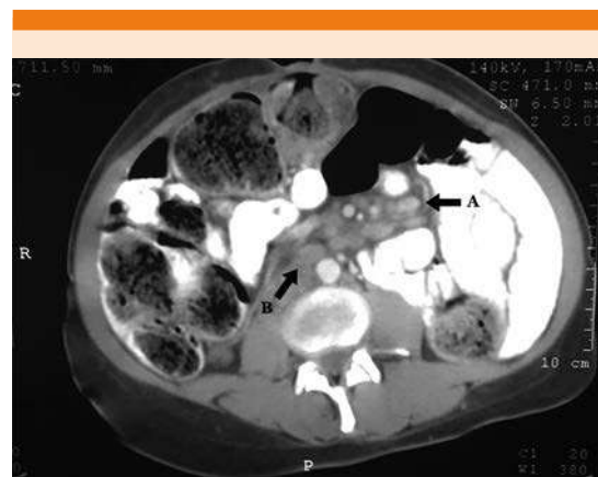
Figura 1. A. Adenopatías mesentéricas. B. Adenopatías retroperitoneales.

La sarcoidosis gastrointestinal es una forma rara de sarcoidosis extrapulmonar. La mayoría de