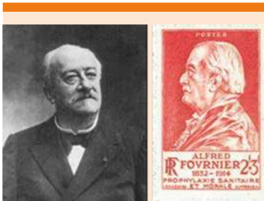
Figura 1. Jean Alfred Fournier, Francia, febrero de 1946 (Stanley Gibbons 960, Scott B201). 20