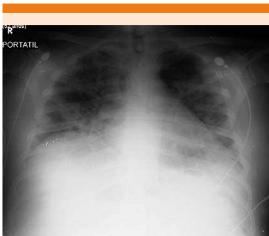
Figura 1. Radiografía de tórax que muestra radioopacidades retículo-intersticiales en ambos pulmones.

La radiografía de tórax mostró radioopacidades retículo-intersticiales en ambos pulmones ( Figura 1 ), éstas se confirmaron con una TAC de tórax que demostró parénquima pulmonar con engrosamiento de los septos inter e intralobulillares, algunas zonas de consolidación de localización dispersa y bilateral con predominio subpleural, con configuración redondeada, la mayor parte asociados con broncograma aéreo y otras en vidrio despulido, dispuestas en parches de forma difusa y bilateral ( Figuras 2 y 3 ). Por los hallazgos de imagen se decidió tomar prueba de reacción en cadena de polimerasa de transcripción inversa (RT-PCR) SARS-CoV-2 que dio resultado positivo. Se decidió internar al paciente con aislamiento respiratorio, recibió tratamiento de sostén con oxígeno, analgésicos y antipiréticos. Fue hospitalizado durante una semana notando mejoría significativa, el paciente fue dado de alta con aislamiento a su hogar.