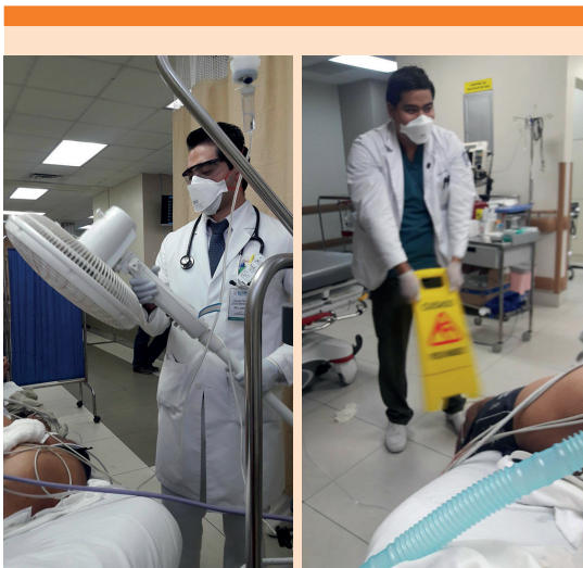
Figura 1. Mecanismos de pérdida de calor. Evaporación (se rocía al paciente desnudo con agua tibia mientras que los ventiladores se utilizan para soplar aire sobre la piel húmeda) y convección (transferencia directa de calor a corrientes de aire convectivas).

En León, Guanajuato, la temperatura varía de 6 a 31 °C con extremos de, incluso, 3 y 34 °C. La temporada calurosa inicia en el mes de abril y termina en junio y la temperatura promedio es de 29 °C. 4