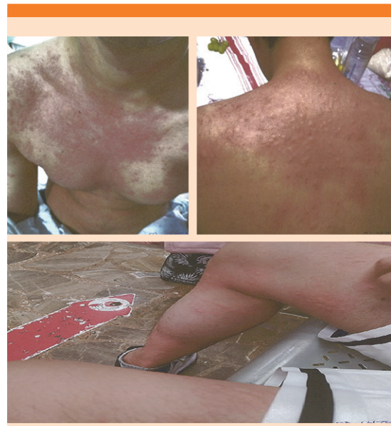
Figura 1. Urticaria generalizada al inicio del cuadro clínico y motivo de la consulta inicial.

Paciente masculino de 19 años, originario de la Ciudad de México, previamente sano. El 2 de abril de 2023, posterior a la ingesta de comida en la vía pública (hamburguesa), manifestó urticaria en el tórax anterior y posterior y las extremidades superiores e inferiores ( Figura 1 ). Recibió tratamiento médico con cetirizina, valganciclovir e hidrocortisona; 72 horas después tuvo visión borrosa, diplopía e inestabilidad a la marcha. Acudió a una unidad médica privada y fue hospitalizado para el proceso diagnóstico de la dermatosis. La química sanguínea, la biometría hemática y los reactantes de fase aguda no mostraron alteraciones; la concentración de procalcitonina era de 0.31 ng/mL. El 6 de abril refirió reducción del campo visual e imposibilidad para la aducción del ojo derecho, midriasis bilateral y arreflexia pupilar bilateral. El examen de fondo de ojo no evidenció alteraciones en la retina.