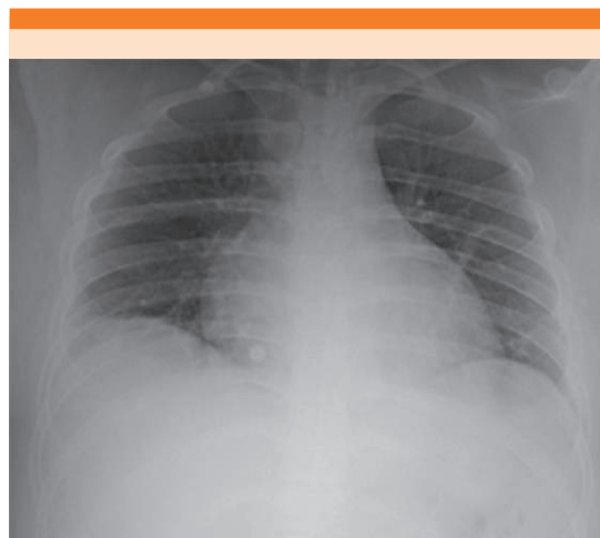
Figura 1. Radiografía de tórax que muestra aumento de ambas cavidades cardíacas (cardiomegalia) y un patrón de redistribución vascular.

A su ingreso a la unidad de Urgencias la tensión arterial fue de 140/80 mmHg, frecuencia cardíaca de 132 latidos por minuto y frecuencia respiratoria de 24 por minuto. Se auscultaron estertores crepitantes generalizados, ruidos cardíacos aumentados en tono y en galope, además de edema de miembros inferiores ++. En el electrocardiograma de 12 derivaciones solo se observó taquicardia sinusal. La radiografía de tórax demostró cardiomegalia y patrón de redistribución de flujo. Figura 1