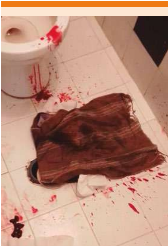
Figura 1. Motivo de consulta: rectorragia.

el 50% de la circunferencia, cubierta de fibrina, gran friabilidad; el resto de la región con glándula hipertrófica y congestión severa con vasos visibles. Figura 2