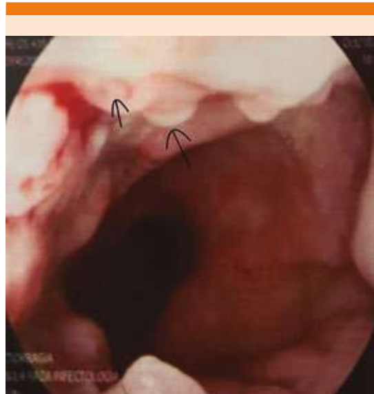
Figura 2. Úlcera rectal que involucra el 50% de la circunferencia, cubierta de fibrina.

El tratamiento establecido consistió en ayuno, inhibidor de la bomba de protones, mesalazina