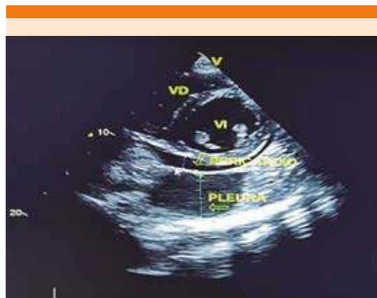
Figura 3. Ecocardiograma al tercer día de hospitalización que reportó dilatación auricular y ventricular izquierda e hipocinesia global. Además, disfunción sistólica severa, con FEVI del 17% y derrame pericárdico de aproximadamente 150 mL, sin taponamiento cardiaco.

Las puntuaciones de gravedad (porcentaje de mortalidad) se calcularon con los datos de laboratorio al ingreso y al tercer día de hospitalización.