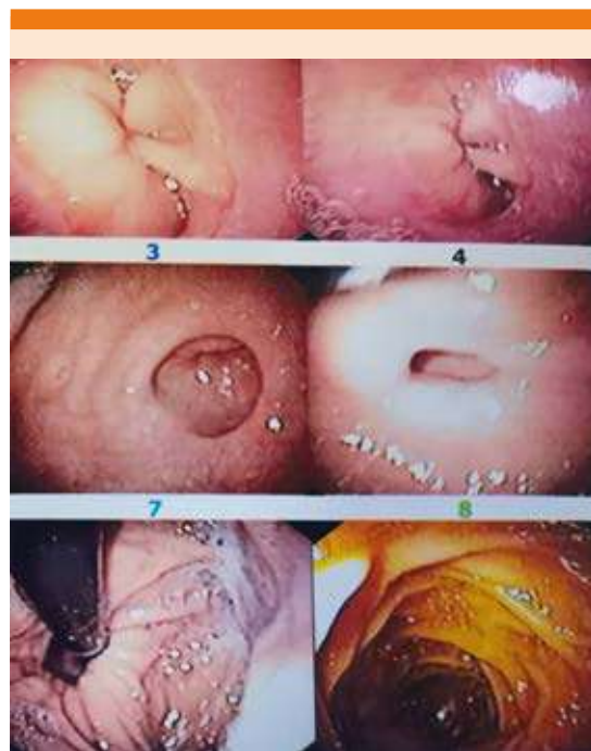
Figura 1. Endoscopia sin evidencia de sangrado activo.

Durante su internamiento, como parte del abordaje de síndrome anémico y con antecedente de una hospitalización asociada con aparente sangrado del tubo digestivo alto, se realizó endoscopia que reportó gastritis corporal crónica de tipo folicular sin datos de sangrado activo ( Figura 1 ) y colonoscopia que se reportó sin evidencia de sangrado activo. El paciente se mantuvo asintomático, por lo que egresó a domicilio continuando protocolo diagnóstico por externo; sin embargo, los siguientes dos meses acudió al servicio de urgencias por síndrome anémico, identificando bicitopenia, caracterizada por patrón de anemia normocítica normocrómica y trombocitopenia moderada (hemoglobina 6.4 g/dL y plaquetas 118,000/ \mu L). Una segunda endoscopia y colonoscopia no evidenciaron ningún sitio de sangrado. Se realizó cinética de hierro, que reportó concentraciones de hierro y porcentaje de saturación de transferrina en rangos