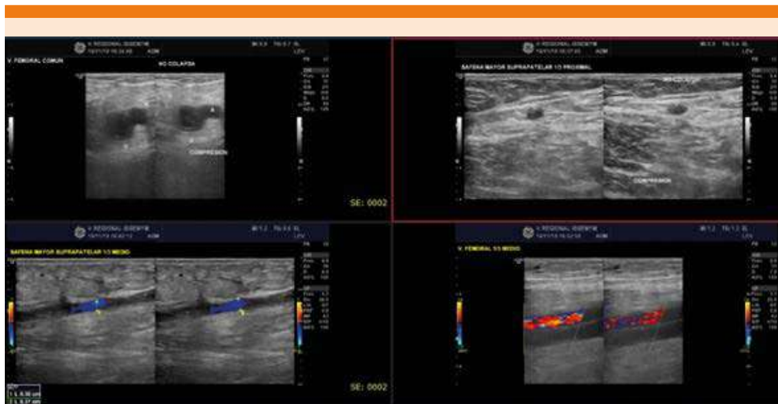
Figura 3. Ultrasonido Doppler.