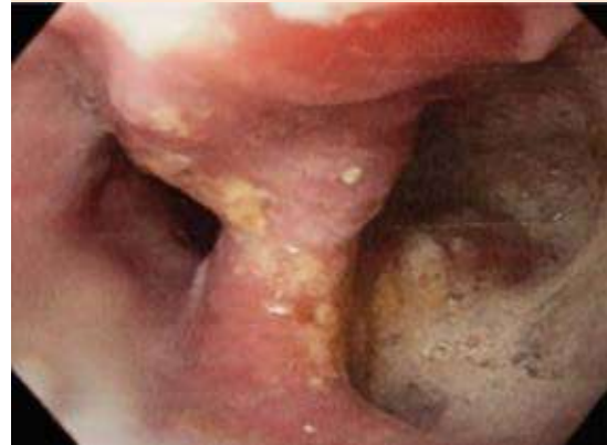
Figura 1. Endoscopia que muestra herniación de la mucosa en la pared antero-lateral del esófago cervical, por debajo del músculo cricofaríngeo.

Se inició abordaje con estudio tomográfico simple de cuello y tórax, con reporte de engrosamiento concéntrico y progresivo de la porción torácica del esófago, cambios atróficos con osteofitos marginales anteriores en diferentes segmentos cervicales; posteriormente se realizó endoscopia diagnóstica, ya que a pesar del manejo parenteral con antiemético persistía con náusea. Los hallazgos fueron panesofagitis ulcerada, hernia hiatal tipo 1 fija en tórax y pinzamiento valvular grado 3 ( Figura 1 ). Se mantuvo en vigilancia intrahospitalaria con inicio progresivo de dieta enteral y 48 horas posteriores al manejo con inhibidor de la bomba de protones y protector de mucosa con horario se logró realizar esofagograma ( Figura 2 ). Al no encontrar datos de broncoaspiración ni trastornos severos en la deglución se egresó a domicilio con dieta específica y suplementación nutricional; se descartó la opción quirúrgica-endoscópica al no representar incapacidad funcional. El