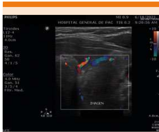
Figura 2. Ultrasonido de tiroides con imagen heterogénea dependiente de paratiroides inferior derecha, hipervascularizada.

0.4 nmol/L, T3L nmol/L, 2.75 nmol/L, T4T 2.23 nmol/L y T4L 0.69 nmol/L. Se diagnosticó hiperparatiroidismo e hipotiroidismo primario por lo que se inició tratamiento con levotiroxina y se solicitó gammagrama paratiroideo con sestamibi ( Figura 3 ) que confirmó el diagnóstico de adenoma paratiroideo, mismo que fue resecado quirúrgicamente sin complicaciones y con conservación de la glándula tiroidea. El reporte de histopatología confirmó el diagnóstico presuntivo ( Figura 4 ), el valor de calcio posquirúrgico fue de 9.4 mg/dL y la paratohormona de control fue de 41.2 pg/mL. La paciente fue egresada del hospital y continúa en citas de control en los servicios de gastroenterología, endocrinología, cirugía y urología.