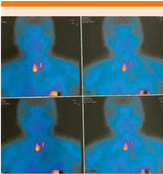
Figura 3. Gammagrama paratiroideo con sestamibi con hipercaptación en el polo inferior de la tiroides derecha.