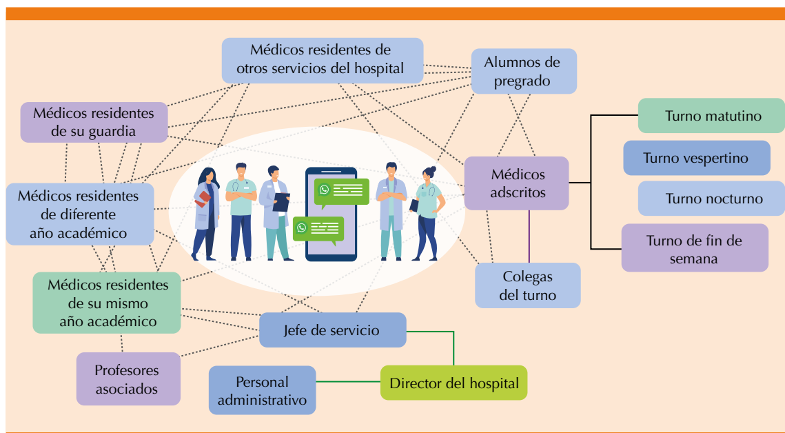
Figura 1. Grupos de WhatsApp del personal médico.

Con base en lo anterior, el personal médico deberá conocer los aspectos jurídicos en torno a la protección de datos personales de los pacientes con la finalidad de salvaguardar los mismos y no incurrir en responsabilidades en su ejercicio profesional.