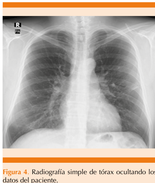
Figura 4. Radiografía simple de tórax ocultando los datos del paciente.