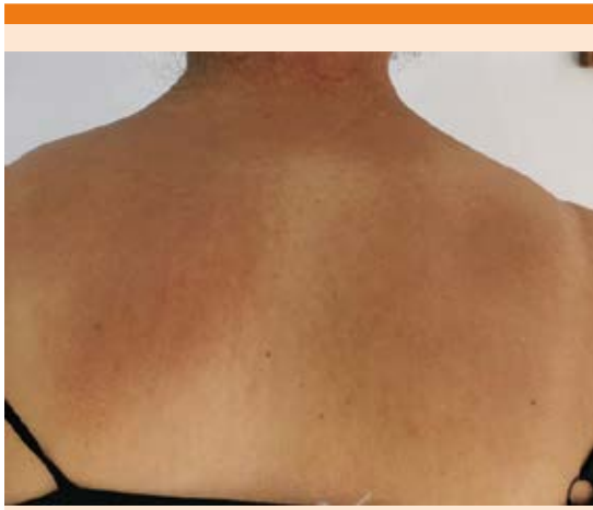
Figura 5. Hiperpigmentación en la región dorsal, posterior a un mes de tratamiento.

cuadro clínico fue de curso crónico e insidioso, predominando en las salientes óseas, sin alteraciones del estado general ni en las mucosas. En la paciente se confirmó el dato de fricción intensa con el uso de la toalla japonesa durante el baño.