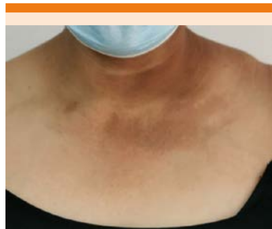
Figura 4. Máculas pigmentadas en la región torácica anterior, posterior a un mes de tratamiento.

evitar fricción y acumulación de depósito amiloide. Después de un mes, hubo alivio de las lesiones, continuando con dos meses más con dimeilsulfóxido al 10%, fotoprotector cada 3 horas, así como evitar fricción en las lesiones.