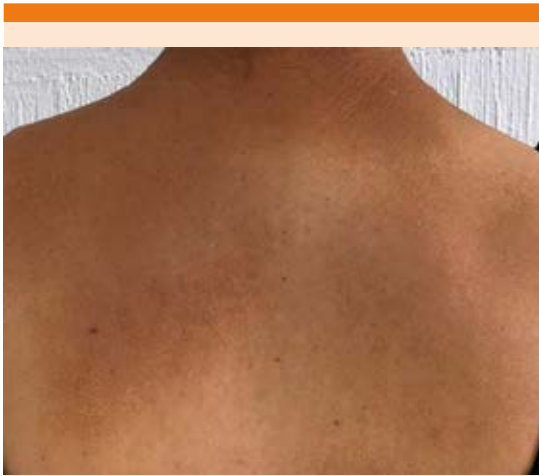
Figura 2. Hiperpigmentación en la región dorsal.

análoga del dolor 7/10. Al interrogatorio dirigido refirió el uso de toalla japonesa de fibra vegetal, realizando fricción como aseo personal y tratamiento tópico prescrito por médico dermatólogo con fluocinolona y clioquinol al 0.01% durante 3 meses, sin mejoría.