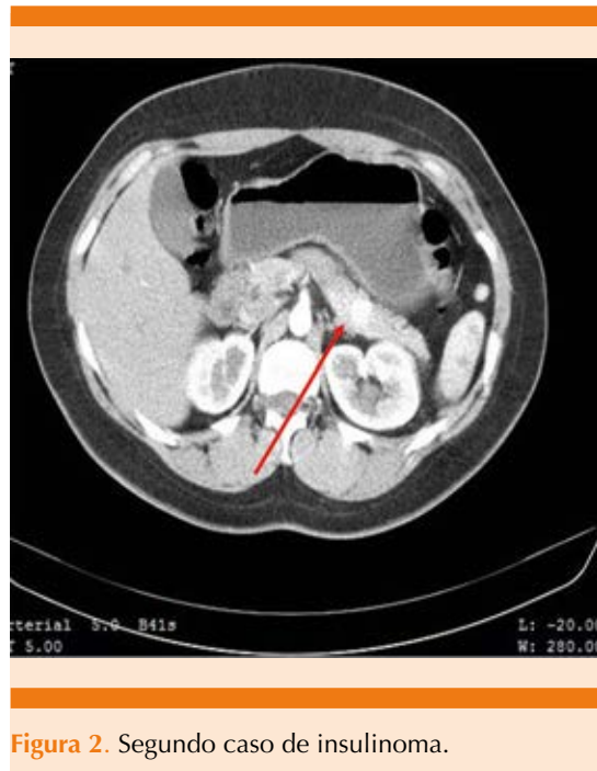
Figura 2. Segundo caso de insulinoma.

lizada, de inicio agudo, mareos y diaforesis de 4 meses de evolución. En urgencias médicas se encontró con glucemia de 26 mg/dL. La paciente recibió glucosa intravenosa con mejoría notoria. Posteriormente refirió otros cuadros similares con mejoría consumiendo alimentos ricos en carbohidratos. Con estos antecedentes se efectuó un perfil bioquímico para medir la insulina y la proinsulina; ambos resultaron mayores de los límites normales de referencia ( Figura 2 ). Las pruebas de función tiroidea fueron normales. El siguiente paso fue localizar el insulinoma. La TAC abdominal con contraste con cortes finos identificó una imagen ovoidea, vascularizada de 1.42 cm en el cuerpo del páncreas, com-