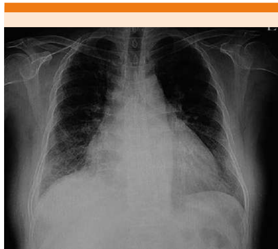
Figura 1. Radiografía de tórax posteroanterior con neumonía en la base pulmonar derecha y redistribución de flujo.

Como datos positivos en los estudios complementarios el electrocardiograma mostró BIRD, y en el laboratorio de rutina se detectó leucocitosis (glóbulos blancos 23,000 células/mm 3 ) sin eosino-