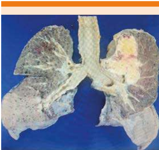
Figura 3. Corte coronal postmortem de ambos pulmones y tráquea. Tumor de 11 x 6.5 cm localizado en la parte medial del lóbulo pulmonar superior izquierdo. El resto de los pulmones muestra áreas difusas de fibrosis.

Se estima que en todo el mundo durante 2018, cerca de 18.1 millones de personas fueron diagnosticadas con cáncer, de las cuales 9.6 millones han muerto por esta causa. El cáncer más frecuente es, sin duda, el cáncer de pulmón representando un 11.6 % de todos los casos. 10