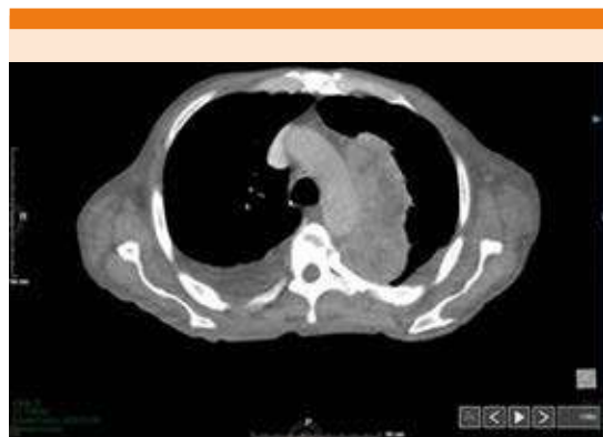
Figura 1. Tomografía de tórax contrastada. Imagen paraaórtica de 78 x 38 mm con reforzamiento heterogéneo a la aplicación de medio de contraste de hasta 86 HU.

Se realizaron dos bronoscopias, ninguna fue concluyente, el cepillado y lavado bronquial con reporte histopatológico de proceso inflamatorio agudo y crónico. Se programó para