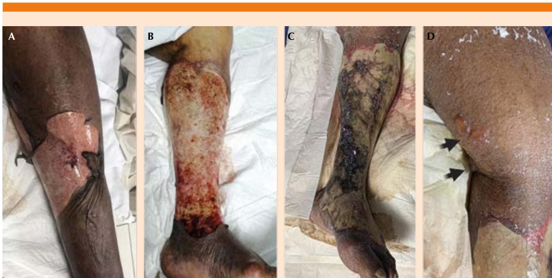
Figura 1. A. Flictena con extensa exulceración en la pierna izquierda, aspecto al ingreso a sala de medicina interna. B. Aspecto de la lesión en la pierna derecha derivada de la flictena descrita a las 24 horas C. Extensa escara en la pierna izquierda a las 72 horas de ingreso. D. Nuevas flictenas a tensión en la parte posteromedial inferior del muslo y la cara posterior de la rodilla izquierda.

La evolución clínica posterior al cambio de antibióticos fue hacia la mejoría, con normalización de la cuenta leucocitaria, remisión de la lesión renal y retiro de aminas vasoactivas. A pesar del progreso hacia el alivio, durante el día 10 de internamiento la paciente tuvo muerte súbita de origen cardíaco.