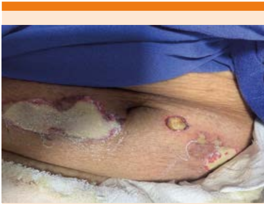
Figura 2. Lesiones metastásicas, numulares y elípticas, aisladas y coalescentes, por V. vulnificus en el abdomen.