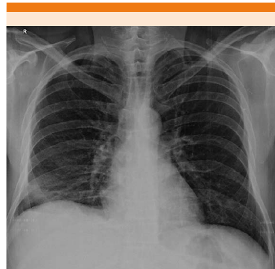
Figura 4. Disminución del derrame pleural con persistencia de una atelectasia basal derecha.

Los pacientes con derrame pleural tuberculoso generalmente manifiestan muy pocos síntomas. El síntoma más común es el dolor pleurítico con tos no productiva y síntomas constitucionales, 2 lo que no fue el caso de este paciente que inicialmente se manifestó como anasarca generalizada