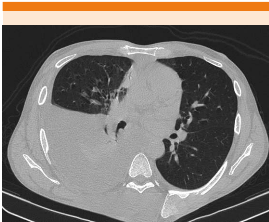
Figura 2. TAC que muestra derrame pleural derecho.

rimiento de oxígeno y con hipoventilación en hemitórax derecho, por lo que se solicitó tomografía de tórax ( Figura 2 ) que evidenció persistencia del derrame pleural sin consolidaciones o masas asociadas, lo que obligó al estudio de líquido pleural que reportó proteínas de 530 mg/dL, lactato deshidrogenasa 192 U/L, recuento de glóbulos blancos de 1000/mm 3 , neutrófilos 53%, linfocitos 47%, glucosa 128 mg/dL, baciloscopia de líquido pleural positiva (+++) [ Figura 3 ]. Los anticuerpos para VIH y el BK seriado de esputo