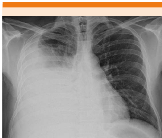
Figura 1. Derrame pleural derecho masivo.

Al tercer día de terapia diurética hubo disminución de los edemas de los miembros inferiores, pero con evolución estacionaria desde el punto de vista respiratorio persistiendo con reque-