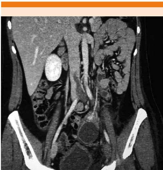
Figura 2. Tomografía computada contrastada abdomino-pélvica con imagen hipodensa en la vena cava inferior y vena ílica común izquierda.