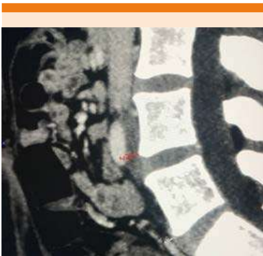
Figura 3. Tomografía computada contrastada de abdomen, corte sagital a nivel lumbar que evidencia la reducción de espacio entre la vena ílica izquierda y la cuarta y quinta vértebras lumbares (línea roja).

tromboembolia pulmonar en ramas segmentarias y subsegmentarias, además de trombosis del segmento ilio-fémoro-poplíteo y tibial izquierdo. Los estudios de laboratorio tomados al ingreso de la paciente se resumen en los Cuadros 1 a 4 . A las 72 h posteriores al ingreso se ingresó a la paciente a sala de hemodinámica en donde se evidenció mediante fluoroscopia el defecto de llenado de la unión iliocava izquierda ( Figura 4 ); se realizó trombólisis fármaco-mecánica del miembro afectado con el dispositivo Eko Sonic Endovascular System (EKOS) y uso de activador tisular del plasminógeno recombinante (recombinant Tissue Plasminogen Activator-rTPA) en infusión. El dispositivo EKOS se retiró 24 horas después y se realizó una trombectomía por aspiración mediante Penumbra ( Figura 5 ), además de ultrasonido intravascular (Intravascular Ultrasound - IVUS), angioplastia y colocación