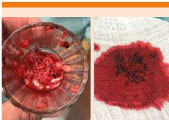
Figura 5. Trombos obtenidos después del procedimiento de trombectomía por aspiración.