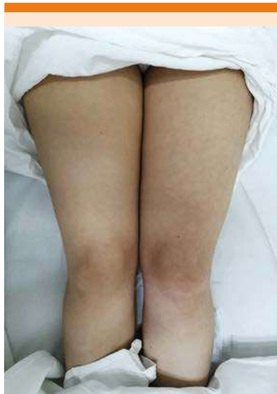
Figura 1. Miembros pélvicos de la paciente. El miembro pélvico izquierdo muestra livedo reticularis , edema y cambios en la coloración de la piel.

Paciente femenina de 33 años de edad sin antecedentes de padecimientos crónico-degenerativos, ni antecedentes familiares de tromboembolismo. La paciente refirió dolor lumbar sordo, intensidad 5/10, sin irradiaciones en los 10 meses previos. Tabaquismo, alcoholismo, toxicomanías y administración de anticonceptivos orales y hormonales negados. Inició su padecimiento con livedo reticularis y edema, cambios en la coloración ( Figura 1 ), dolor opresivo en el miembro pélvico izquierdo de intensidad 5/10, que evolucionó a 8/10 en las primeras seis horas, así como dificultad para la deambulación, por lo que acudió al servicio de urgencias. A la exploración física se observaron signos vitales dentro de parámetros normales, así como cambios en la coloración del miembro pélvico izquierdo y edema, por lo que el