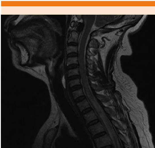
Figura 1. Hiperintensidad de cordón medular de C6-T6.

La punción lumbar reportó pleocitosis con 40 células y 65% de mononucleares, glucosa 85 mg/dL, proteínas 150 mg/dL, bandas oligoclonales ausentes.