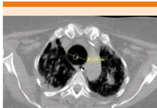
Figura 3. Tomografía axial computada de tórax con opacidades bilaterales, áreas de consolidación y broncograma aéreo. Tubo endotraqueal visible en la luz de la tráquea. Tráquea con diámetro de 37.06 mm.

El síndrome de Mounier-Kuhn fue reconocido por primera vez en una autopsia realizada por Czyhlarz en 1897, descrito en 1937 y en 1988 se visualizó en una tomografía computada de tórax por primera vez. 5,6 Se han reportado 360 casos en la bibliografía médica. 5