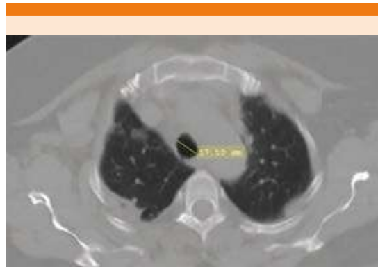
Figura 1. Tomografía axial computada de tórax que muestra opacidades bilaterales de predominio subpleural. Tráquea con diámetro de 17.10 mm.

La tomografía de tórax inicial reportó tráquea con diámetro de 17.10 mm, bronquio principal derecho de 15.39 mm y bronquio principal izquierdo de 10.20 mm con calibre normal sin zonas de estrechez, imágenes tomográficas típicas de COVID-19, litiasis vesicular sin datos de agudización y cambios osteodegenerativos de la columna. Figuras 1 y 2