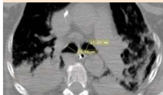
Figura 4. Tomografía axial computada de tórax con áreas de consolidación y aumento en el diámetro de los bronquios respecto a la tomografía de ingreso.

La clasificación engloba tres grandes grupos basados en la apariencia anatómica. 1 Tipo I con ensanchamiento difuso simétrico en la tráquea y los bronquios. 1 Tipo II con ensanchamiento excéntrico, divertículo pronunciado y bronquio de diámetro normal, éste es el más común. 1 Tipo III, en el que el divertículo puede extenderse hasta el bronquio, se han reportado pocos casos de este tipo. 1