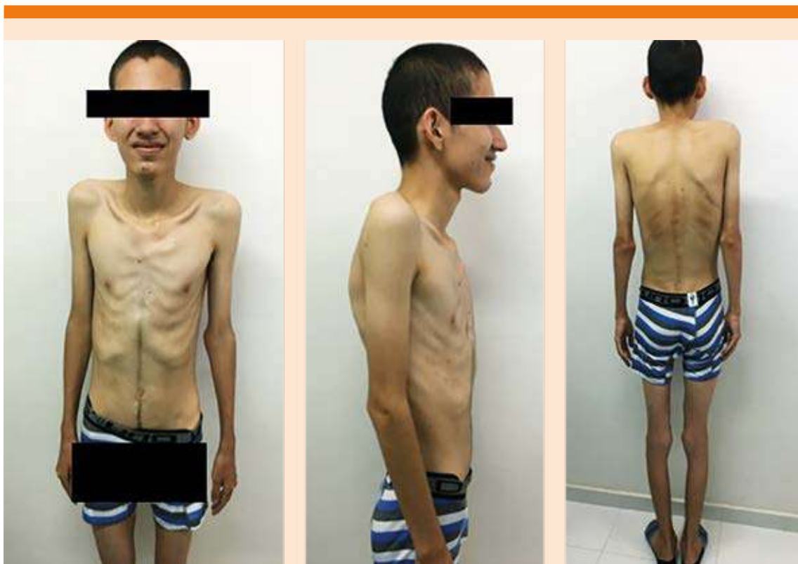
Figura 1. Aspecto caquéxico, escoliosis de vértebras lumbares y cicatriz quirúrgica en la zona subescapular derecha.

La discinesia ciliar primaria se caracteriza por disfunción en la motilidad ciliar. 1 Inicialmente se describió una tríada caracterizada por sinusitis crónica, bronquiectasias y situs inversus , la cual posteriormente se asoció con infecciones recurrentes de las vías respiratorias; configurando así el llamado síndrome de Kartagener. 2 Con el desarrollo de la microscopía electrónica se descubrieron alteraciones funcionales y estructurales ciliares que definen la discinesia