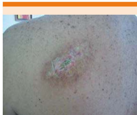
Figura 1. Aspecto clínico después de una biopsia.

Se realizó biopsia incisional y el estudio histológico mostró capa córnea en red de canasta con paraqueratosis focal e hiperqueratosis, con costra serohemática, cúmulos de neutrófilos y restos celulares, sobre una epidermis hiperplásica y en otras áreas atrófica ( Figura 2 ). En la dermis papilar se observaba edema entre las fibras de colágena, áreas de hialinización y esclerosis con vasos sanguíneos dilatados ( Figura 3A ). En el resto de la dermis, en su totalidad y hasta el tejido celular subcutáneo se observaba la colágena acelular, compacta que penetraba en haces gruesos interlobulillares ( Figura 3B ). Se emitió el diagnóstico de dermatitis fibrosante exulcerada. Con la correlación clínica e histológica se diagnosticó como morfea profunda.