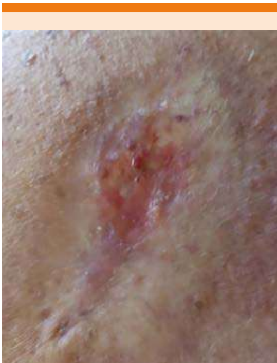
Figura 4. Después del tratamiento, con ulceración después de la biopsia de control.

posición genética por autoanticuerpos contra células endoteliales que llevan al incremento en la producción de colágena y decremento en su destrucción. Para que la enfermedad se manifieste, deben existir los factores antes mencionados, sumados a un factor precipitante, como traumatismo, radiación, medicamentos o infección. 5,7,12