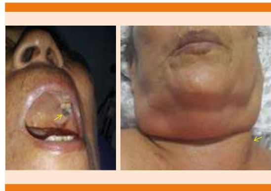
Figura 1. Mujer de 65 años de edad con material purulento en el primer molar superior izquierdo. Edema, eritema y sensación de masa en la región cervical antero-lateral izquierda. Hallazgos durante el examen físico que hacían sospechar como primera opción una angina de Ludwig.

Al examen físico se encontraron los siguientes signos vitales: frecuencia cardíaca 66 lpm, presión arterial 100/70 mmHg, asténica, adolorida, hidratada, con material purulento en el primer molar superior izquierdo, cuello móvil con masa móvil, eritematosa, con edema y calor de aproximadamente 10 x 14 cm a nivel cervical antero-lateral izquierdo ( Figura 1 ); abdomen con abundante panículo adiposo, no doloroso