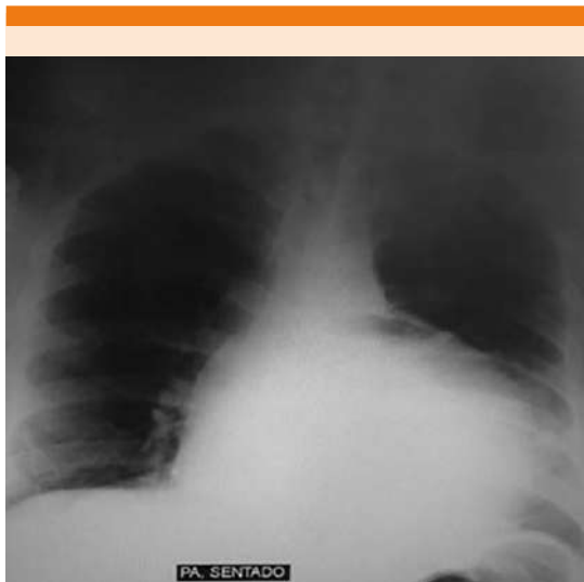
Figura 2. Radiografía posteroanterior de tórax al ingreso con aumento de tamaño de la silueta cardíaca.

400 mL con separación de hoja anterior 19 mm y posterior 19 mm, función ventricular derecha disminuida TAPSE 11 mm, FEVI 61%, válvulas cardíacas sin alteraciones. Figura 3