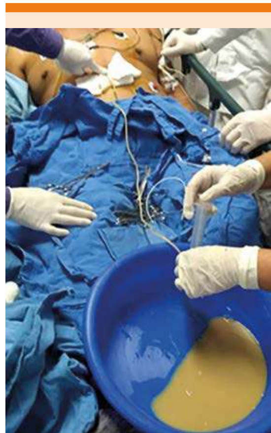
Figura 4. Pericardiocentesis de emergencia por taponamiento con 500 mL de líquido purulento drenado.

Con los hallazgos clínicos y de gabinete se estableció el diagnóstico de taponamiento cardíaco secundario a pericarditis aguda; se realizó pericardiocentesis ( Figura 4 ) de forma urgente; se extrajeron 500 mL de líquido purulento con lo que mejoró el estado hemodinámico, registrando presión arterial de 100/60 mmHg, frecuencia cardíaca 80 lpm; examen físico-químico del líquido reportó: aspecto purulento, leucocitos 86,070 cél/mm 3 , neutrófilos 89%, linfocitos 20%, proteínas 230 mg/dL, tinción de Gram positiva, BAAR negativa, ADA 39 U/L; el cultivo de líquido pericárdico y hemocultivos reporta-