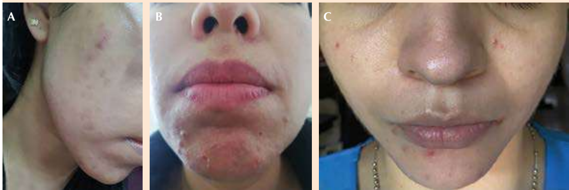
Figura 2. Evidencia fotográfica proporcionada por los participantes. A. En el área de la mejilla se observan nódulos e hiperpigmentación posinflamatoria. B. Pápulas y pústulas en el área de la barbilla. C. Lesiones inflamatorias por acné mecánico en el área de la mascarilla (mejillas, barbilla y zona perioral).

El aumento de la humedad de la piel tiende a aumentar la adherencia entre la tela y la piel, así como la fricción, lo que resulta en molestias por el uso y lesiones. Por ello, aunque se ha demostrado que las fibras naturales absorben la humedad, tienen mayor saturación de líquidos, lo que aumenta la incomodidad y la sensación de pegajosidad (magnitud de pegajosidad acumulada); mientras que los textiles biofuncionales sintéticos tienen alto coeficiente de evaporación-enfriamiento y son resistentes al agua, lo que evita la propagación de biofluidos. Además, el alto número de hilos y las telas de tejido apretado tienen un factor de protección ultravioleta (UPF) más alto y minimizan la fricción entre el tejido y la piel, 8 aspectos a tomar en cuenta para la elección de mascarillas entre el personal de salud.