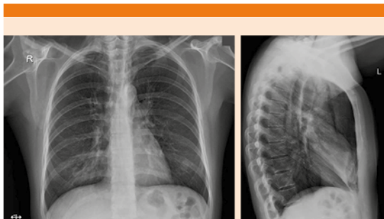
Figura 1. Radiografía posteroanterior y lateral de tórax: se observa engrosamiento peribroncovascular parahiliar bilateral, así como zona de aumento de la radiopacidad con broncograma aéreo en topografía del lóbulo medio que es más evidente en la proyección lateral. Imágenes lineales radiolúcidas en topografía del mediastino que se hacen evidentes en la proyección lateral.

que acudió a valoración a Urgencias. A su ingreso tenía presión arterial de 150/60 mmHg, 120 latidos por minuto, 26 respiraciones por minuto, saturación parcial de oxígeno de 80% al aire ambiente. A la exploración se apreció uso de músculos accesorios de la respiración, disminución de entrada y salida de aire en ambas bases pulmonares, con sibilancias espiratorias en la región interescapular bilateral, los ruidos cardiacos con adecuado tono e intensidad, con sonido crepitante sincronizado con los latidos cardiacos (signo de Hamman). Se palparon crepitantes y enfisema subcutáneo en ambas caras laterales del cuello. Se tomaron gases arteriales que reportaron un pH 7.45, pCO 2 30.9 mmHg, pO 2 44.2 mmHg, HCO 3 21.6 mEq/L, SaO 2 77%, lactato 1.0 mmol/L. Con estos datos en el servicio de Urgencias se solicitaron laboratorios, con PCR para influenza A (H1N1) 2009 positiva, tinción de Gram negativa, biometría hemática con hemoglobina de 14.2 g/dL, hematócrito 48.6%, plaquetas 396,000, leucocitos 8700, neutrófilos totales 6960, linfocitos totales 690. La radiografía de tórax posteroanterior y lateral (Figura 1) reportó consolidación en el lóbulo