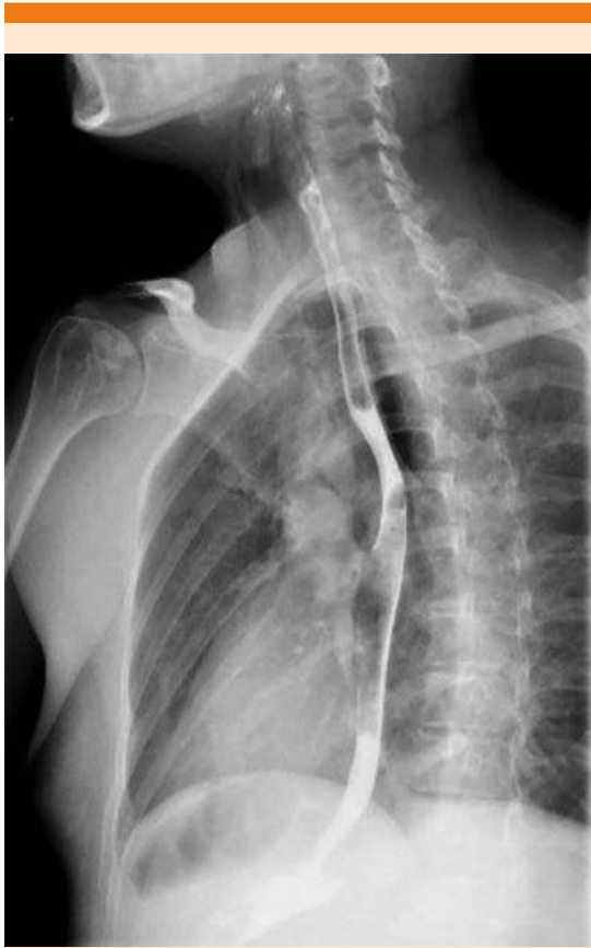
Figura 3. Esofagograma con medio de contraste hidrosoluble: no se observa fuga del material de contraste. Con aire en el mediastino y en el espacio prevertebral en topografía cervical.

uso de la tomografía computada es más efectivo que el de radiografías de tórax por sí solas en el diagnóstico del neumopericardio. 11-14