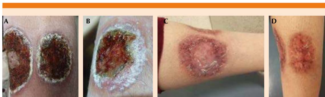
Figura 2. Evolución de las lesiones posterior a un mes ( A y B ) y cinco meses de tratamiento ( C y D ). La mayor parte de las lesiones suelen dejar una cicatriz atrófica, que puede acompañarse o no de hipopigmentación.