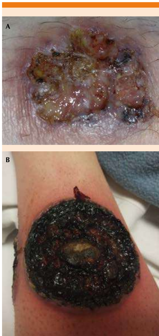
Figura 1. A. Lesión inicial. Borde violáceo mal definido, ulceración interna y exudado purulento, se logra apreciar la aparición de pequeñas zonas de necrosis. B. Evolución ulcerosa de la lesión. Abundantes costras hemáticas y fondo francamente purulento, llama la atención el crecimiento circular de la lesión, misma forma en que se realizaban los aseos.

de alivio espontáneo. La exploración física, más allá de las alteraciones cutáneas, no mostró